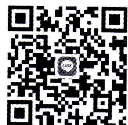
QR Code Line Group

เพิ่มศักยภาพผู้ตรวจสอบภายในมี หน่วยงานภาครัฐอย่างอาชีพ รุ่นที่ ๑