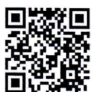
กำหนดการอบรม

นักจัดการงานทั่วไปชำนาญการพิเศษ รักษาการแทน ผู้อำนวยการสำนักงาน สทศ. จังหวัดนครราชสีมา