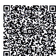
ลงทะเบียนอบรม Online

งานสวัสดิการ งานสวัสดิภาพและสิทธิประโยชน์แก่กุล โทร.๐๔๔-๒๔๔-๕๘๘